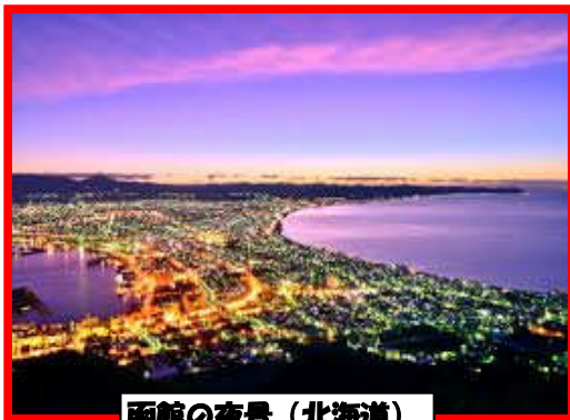
函館の夜景（北海道）