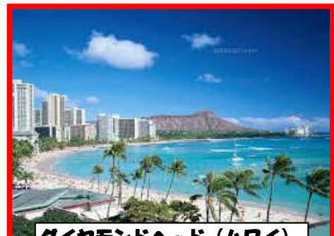
ダイヤモンドヘッド（ハワイ）