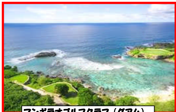
マンガラオゴルフクラブ（グアム）