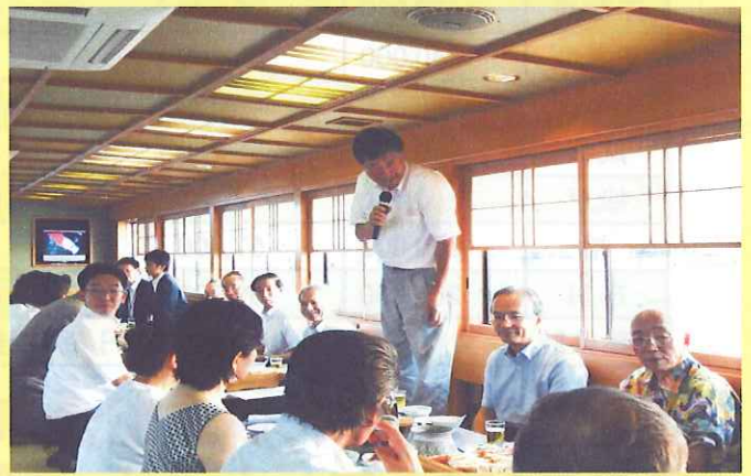
【小菅共済部長ご挨拶】